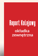
Okladka tył strona 4 210 x 297 mm