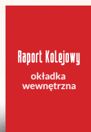
Okladka wewnętrzna strony 2, 3 210 x 297 mm