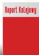
Okladka strona 1 210 x 217,5 mm