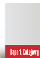
1/4 strony A4 poziom 210 x 74 mm