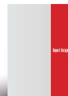
1/3 strony A4 71,5 x 297 mm