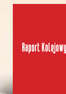
Strona A4 210 x 297 mm