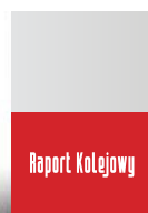
1/2 strony A4 210 x 141,5 mm