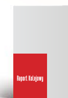
1/4 strony A4 pion 100 x 141,5 mm