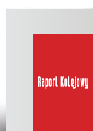
Junior Page 133 x 204,5 mm