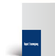
1/4 strony A4 pion 100 x 141,5 mm