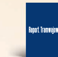
Strona A4 210 x 297 mm