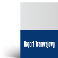
1/2 strony A4 210 x 141,5 mm