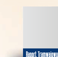
Podwał na okładkę 210 x 40 mm