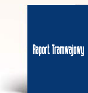
Okladka wewnętrzna strony 2, 3 210 x 297 mm