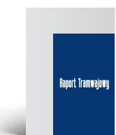
Junior Page 133 x 204,5 mm