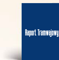
Okladka tył strona 4 210 x 297 mm