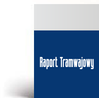
Okladka strona 1 210 x 217,5 mm